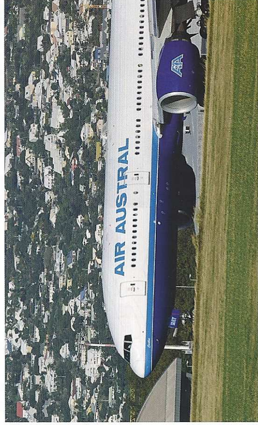
à ce voyage ont dû être acheminés via Plaisance par Air Mauritius. Début novembre, Air Austral

L'ouverture de la ligne Réunion-Chennai faisait partie des grandes nouveautés du business plan présenté par la nouvelle équipe dirigeante d'Air Austral, à la fin du premier semestre. L'escalade dans le sud de l'Inde était une nécessité, après la décision de mettre en ligne des B 737 sur la route de Bangkok, pour en réduire le déficit. Les avions moyen-courrier, de plus faible rayon d'action, ne peuvent en effet rallier directement la capitale thaïlandaise. Air Austral a voulu saisir cette occasion en ouvrant également une escale commerciale à Chennai, pour prendre position dans le sous-continent indien. Mais les choses ne semblent pas si simples. Fin octobre, les autorités indiennes n'avaient toujours pas accordé les indispensables droits de trafic et les premiers B 737 décollant pour Bangkok, en ce début de saison aérienne « d'hiver », n'ont pu emporter de passagers pour Chennai. Les premiers candidats